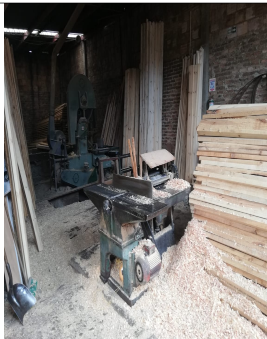
Fotografía No 4 equipo de cepillado