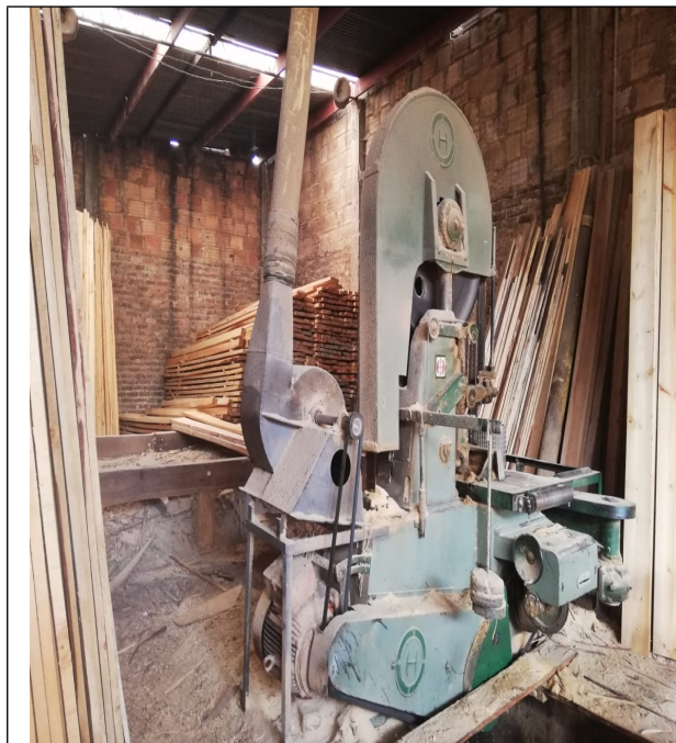
Fotografía No 3. Sierra sinfín