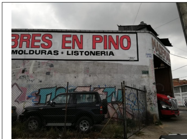
Fotografía No 1. Fachada predio