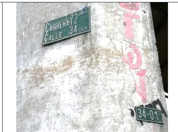
Fotografía No 2. Nomenclatura del predio