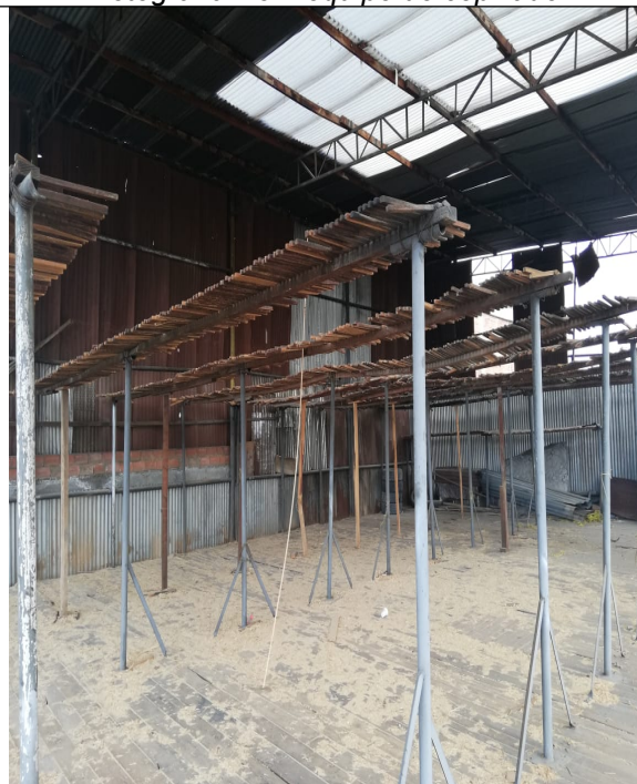
Fotografía No 6. Área de secado en frío