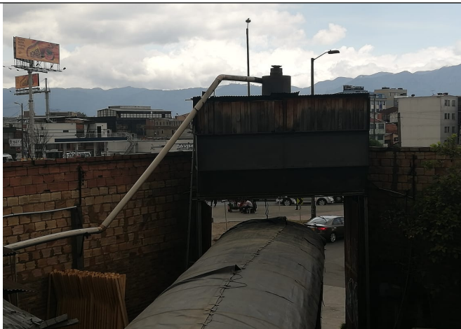
Fotografía No 7. Sistema de ciclón